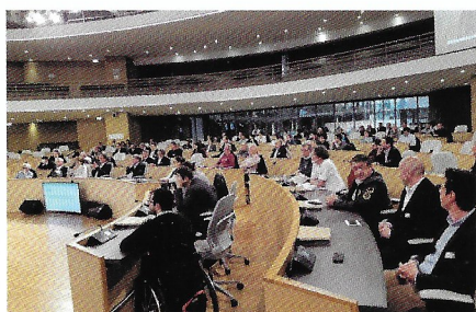
Hôtel de région : table ronde sport automobile électrique