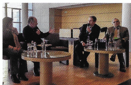
Conseil départemental de Haute-Loire : lancement du plan IRVE