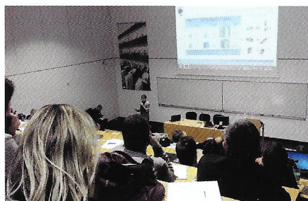
INSA-IFSTTAR : journée technique mobilité électrique