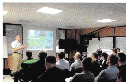
Chambéry : formation bureaux d'études (Legrand)