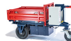
Kross Builder 500 CU:500 kg - Ridelles amovibles