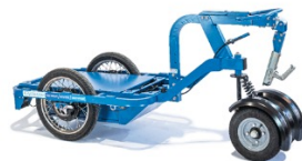
K-Ryole Kustom CU:250 kg