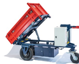
Kross Builder 500V CU:500 kg - Ridelles amovibles avec verin