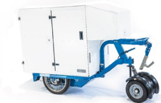
K-Ryole Utilitaire CU:250 kg