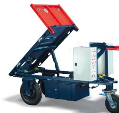
Kross Builder 500V Kustom CU:500 kg - Base nue avec verin