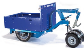
K-Ryole Pick-Up CU:250 kg