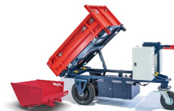
Kross Builder 500 Coffrage CU:500 kg - Spécial phase de coffrage