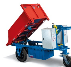
Kross Builder 500 TP CU:500 kg - Spécial enrobé