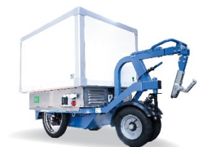
K-Ryole Température dirigée CU:250 kg - Caisse de froid actif 0 -4°C