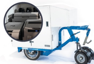
K-Ryole Tri-température CU:250 kg - Caisse à température contrôlée