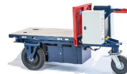
Kross Builder 500 Kustom (KB500KV) CU:500 kg - Base nue