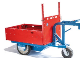
Kross Builder 250 CU:250 kg