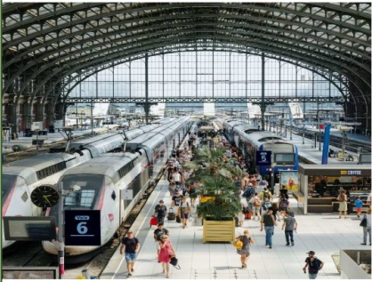
ÉTOILES FERROVIAIRES ET SERVICES EXPRESS MÉTROPOLITAINS SCHÉMA DIRECTEUR